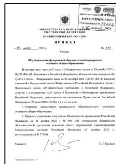
ФОП ООО. Приказ Минпросвещения России от 18 мая 2023 г. № 370