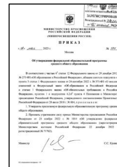
ФОП СОО. Приказ Минпросвещения России от 18 мая 2023 г. № 371